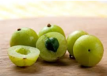
มะขามป้อม (Indian gooseberry)