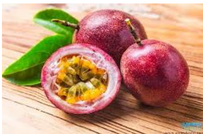
เสาวรส (Passion Fruit)