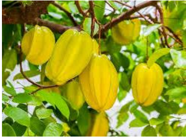
มะเฟือง (Star Fruit)

สามารถทำได้ทุกครัวเรือน ข้อดี ก็คือค่อนข้างจะเป็นมิตรกับสิ่งแวดล้อม เพราะมีจุลินทรีย์ชนิดดีจากน้ำหมักผลไม้รสเปรี้ยวเป็นตัวช่วยย่อยสลายและขจัดสิ่งสกปรกทั้ง สีและกลิ่น เช่น ถ้านำไปซักผ้า จะช่วยป้องกันเชื้อราได้ ชัดห้องน้ำก็จะช่วยกำจัดกลิ่นได้ น้ำที่เหลือจากการล้างจาน ซักผ้า ก็สามารถนำไปรดต้นไม้ ช่วยย่อยสลายสารอาหารในดินให้เป็นปุ๋ยต่อไปได้อีก นอกจากนี้ ต้นทุนการผลิตก็ถือว่าต่ำมาก สามารถทำได้เองอย่างง่าย ๆ รวดเร็ว ผลไม้รสเปรี้ยวที่นิยมนำมาหมัก เช่น