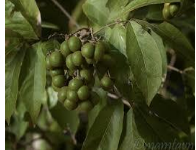
มะค่าตีควาย (Soap Nut Tree)