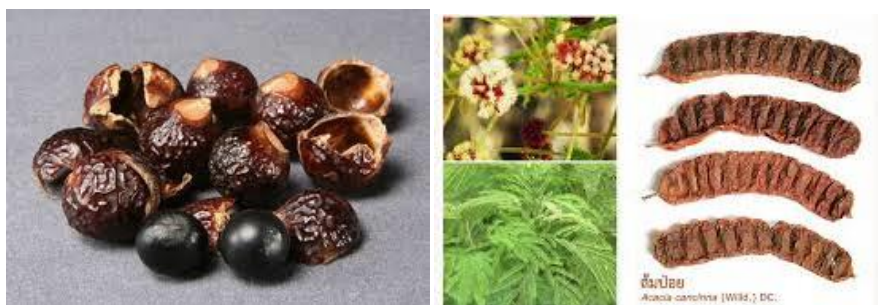
ผลมะคำดีควาย

- น้ำหมักผลมะคำดีควาย มีคุณสมบัติเด่น คือ เมื่อใช้ผสมน้ำล้างหน้า อาบน้ำ จะช่วยลดผดผื่นคัน บรรเทากลากเกลื้อน เมื่อผสมในน้ำยาสระผม มีคุณสมบัติ ช่วยลดรังแค รักษาอาการคันระตุ