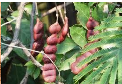
ส้มป่อย ( Acacia concinna )