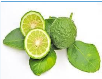
มะกรูด (Kaffir lime)