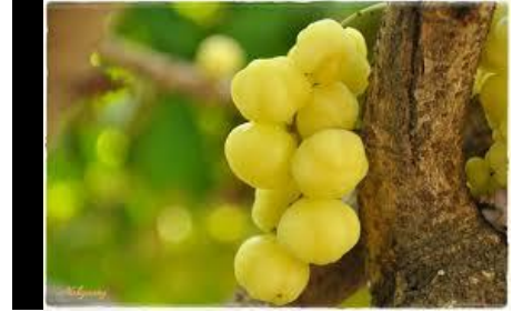
มะยม (Star Gooseberry)