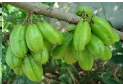
ตะลิงปลิง (Bilimbing)

น้ำที่ได้จากการหมักผลไม้รสเปรี้ยวนี้จะมีฤทธิ์เป็นกรดจัด มีค่าความเป็นกรดเป็นด่าง (pH) ประมาณ 3-3.5 กรดที่ได้นี้มีคุณสมบัติช่วยสลายไขมันหรือขจัดคราบสกปรกต่างๆได้ดี และจะมีกลิ่นหอมของผลไม้หรือกลิ่นน้ำมันหอมระเหยที่อยู่ในเปลือกของผลไม้ และยังมีสรรพคุณอื่นๆ ตามชนิดของผลไม้ที่นำมาหมัก