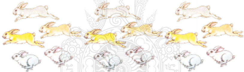
ภาพที่ 24 รูปแบบกระต่าย

การออกแบบกระต่ายขึ้นมาใหม่เพื่อให้มีความรู้สึกที่น่ารักสนุกสนานและน่าเอ็นดูจึงได้ออกแบบให้กระต่ายมีรูปแบบผสมผสานลักษณะกึ่งเหมือนจริงและให้สีอ่อนอารมณ์ ความรู้สึกที่เหนือจริงแบบการ์ตูนแต่มีความละเอียดละไมงดงามอย่างไทย จากนั้นได้นำกระต่ายทั้ง 3 ท่าทาง มาปรับและออกแบบขึ้นมาใหม่ แล้วนำไปประกอบ ร่วมกับตราสัญลักษณ์เดิม ปรับรูปแบบตราสัญลักษณ์เป็นจำนวน 12 แบบ