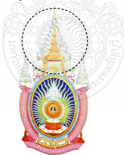
ภาพที่ 23 ตราสัญลักษณ์พระราชพิธีมหามงคลเฉลิมพระชนมพรรษา 80 พรรษา 5 ธันวาคม 2550