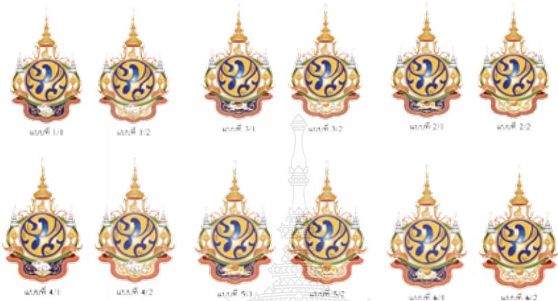
ภาพที่ 25 การปรับรูปแบบตราสัญลักษณ์เป็นจำนวน 12 แบบ

ในการปรับแก้ไขกระต่ายก็ต้องปรับแก้ไขลวดลายรอบพื้นที่กระต่ายไปด้วยเช่นกัน เพราะเมื่อพื้นที่ว่างเปลี่ยน ลวดลายก็ต้องปรับเปลี่ยนตามเพื่อความสอดคล้องเหมาะสม ในครั้งนี้ข้าพเจ้าได้ปรับเปลี่ยนแพรแถบให้มีความกลมกลืน งดงามละเอียดอ่อนยิ่งขึ้น จากนั้นก็นำภาพตราสัญลักษณ์ทั้ง 12 แบบ นำขึ้นทูลเกล้าถวายอีกครั้ง ในที่สุดพระบาทสมเด็จพระเจ้าอยู่หัวทรงมีพระบรมราชวินิจฉัยเลือกแบบตราสัญลักษณ์ 1 ใน 12 แบบนั้นพร้อมกับทรงมีพระราชกระแสว่า “กระต่ายดูแล้วมีอารมณ์ดี” ซึ่งแบบตราสัญลักษณ์นั้นก็คือตราสัญลักษณ์ฯ ที่ใช้ใน “พระราชพิธีมหามงคลเฉลิมพระชนมพรรษา 7 รอบ 5 ธันวาคม 2554” ในปีมหามงคลที่ผ่านมา