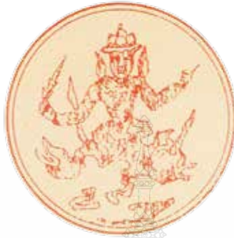
ภาพที่ 1 ตราพระราชสัญลักษณ์เป็นรูปพระนารายณ์ทรงครุฑ

สำหรับการใช้ตราสัญลักษณ์ของพระมหากษัตริย์ไทย มีการใช้มาตลอดแต่พบหลักฐานที่เป็นรูปธรรมชัดเจนและแพร่หลายมากในรัชสมัยรัชกาลที่ 5 มีแบบตราสัญลักษณ์ ใช้เฉลิมพระเกียรติในโอกาสต่างๆ เช่น ตราสัญลักษณ์ งานพระราชพิธีรัชมังคลาภิเษก อันเป็นงานพระราชพิธีสมโภชเนื่องในวาระที่พระบาทสมเด็จพระจุลจอมเกล้าเจ้าอยู่หัว รัชกาลที่ 5 ทรงครองราชสมบัติได้ยาวนานกว่าอดีตบูรพกษัตริย์โดยทรงโปรดเกล้าให้สมเด็จพระเจ้าบรมวงศ์เธอ เจ้าฟ้ากรมพระยานริศรานุวัดติวงศ์ ทรงออกแบบตราสัญลักษณ์ เพื่อเป็นแบบปักหน้าบัตรรอง (ตาลปัตร) สำหรับถวายแด่พระภิกษุสงฆ์ ในงานพระราชพิธีทักษิณานุประทานในครั้งนั้น โดยทรงออกแบบเป็นรูปพระนารายณ์ทรงสุบรรณ