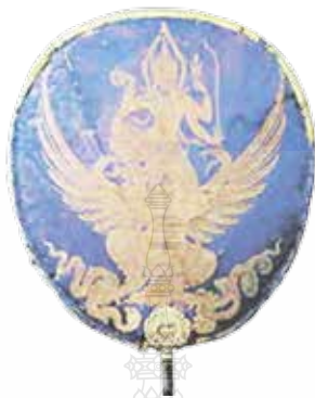
ภาพที่ 2 ตาลปัตรพิธีราชมังคลาภิเษก

ที่มา: อนุรักษ์ภัทร จันทวิช. (2538.) ตาลปัตรพัตยศบนศาสนาสนวัตถ.