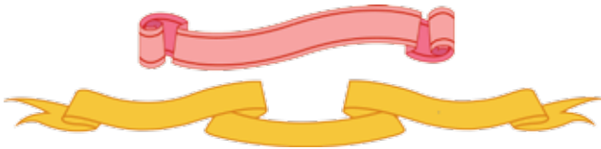
ภาพที่ 14 การจัดวางแพรแถบ

แนวคิดในการวางข้อความ “พระราชพิธีมหามงคลเฉลิม พระชนมพรรษา 7 รอบ 5 ธันวาคม 2554” จะกำหนดรูปแบบ ข้อความ ในแพรแถบให้มีความงดงามและกลมกลืนกับองค์ประกอบหลักของภาพ