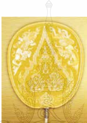
ภาพที่ 3 พัดชนมายุสมมงคล พัดรองสำหรับงานพระราชพิธีพระชนมายุสมมงคล รัชกาลที่ 5 ทรงมีพระชนมายุเสมอรัชกาลที่ 2 พุทธศักราช 2452 ที่มา : สุจิตร์นิทรศการศิลปกรรมบนตาลปัตร เนื่องในวันนริศ. มหาวิทยาลัยศิลปากร. พ.ศ. 2545

ในท่าถลาหะหันเศียรลงเบื้องล่าง หน้าหน้าเข้าหาพระปรมาภิไธยย่อ (สุจิตร์นิทรศการศิลปกรรม บนตาลปัตรเนื่องในวันนริศ : 2554) มีลักษณะรูปแบบแปลกตา มีความคิดสร้างสรรค์ในการออกแบบเพื่อแก้ปัญหา พื้นที่ว่างที่จำกัดได้อย่างลงตัว