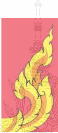
ภาพที่ 13 ลักษณะรูปแบบไทย

แนวคิดในประเด็นต่อมาคือ “ศิลปวัฒนธรรมไทย เอกลักษณ์ ของชาติไทยที่เจริญรุ่งเรืองมาแต่โบราณกาล” ข้าพเจ้าจะกำหนดให้ ลักษณะของภาพตราสัญลักษณ์โดยรวมออกมาในรูปแบบลักษณะของภาพ ศิลปะไทย