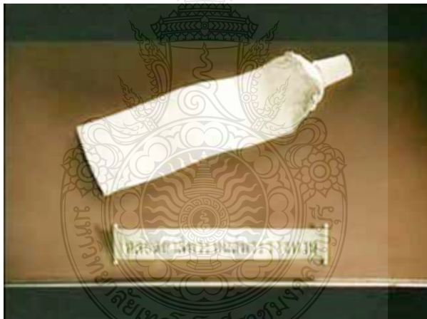
ภาพที่ 12 หลอดยาสีพระทนต์พระราชทาน

ในประเด็นต่อมา “ความภาคภูมิใจที่มีต่อพระบาทสมเด็จพระเจ้าอยู่หัว” สำหรับข้าพเจ้า พระบาทสมเด็จพระเจ้าอยู่หัว พระองค์ท่านทรงเป็นแบบอย่าง ที่ดีที่สุดแต่ที่ข้าพเจ้ามีความประทับใจเป็นพิเศษ จะเป็นเรื่อง ของพระราชจริยาวัตร ความประหยัดเรียบง่ายของพระองค์ท่านเป็นหลัก โดยเฉพาะเรื่องการใช้ยาสีพระทนต์ ที่ทรงใช้ อย่างประหยัด และคุ้มค่า จึงวางกรอบแนวทางในการออกแบบ จะให้ตราสัญลักษณ์มีรูป ลักษณะในรูปแบบ ที่เรียบง่าย