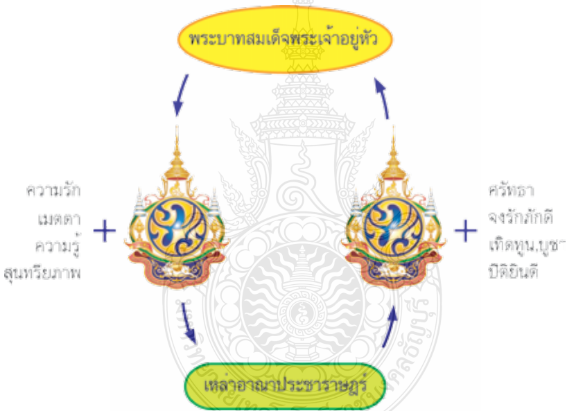
แผนภูมิที่ 1 การสื่อสารตราสัญลักษณ์

ชาวไทย สำหรับประชาชนหรือปวงอาณาประชาราษฎร์ได้นำตราสัญลักษณ์มาใช้ประดับตกแต่ง เพื่อสื่อแสดงถึงความจงรักภักดี ความศรัทธา เทิดทูนบูชา การแสดงออกถึงความปิติยินดี เนื่องในวโรกาสพิเศษแด่องค์พระบาทสมเด็จพระเจ้าอยู่หัว ซึ่งเป็น พลวัต สัญลักษณ์ ขับเคลื่อนอยู่ตลอดเวลาสามารถเขียนเป็นแผนภูมิได้ดังนี้