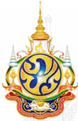
ภาพที่ 10 ตราสัญลักษณ์พระราชพิธีมหามงคลเฉลิมพระชนมพรรษา 7 รอบ 5 ธันวาคม 2554

2.3 พระราชพิธีมหามงคลเฉลิมพระชนมพรรษา 7 รอบ 5 ธันวาคม 2554 ออกแบบโดย นายศิริ หนูแดง