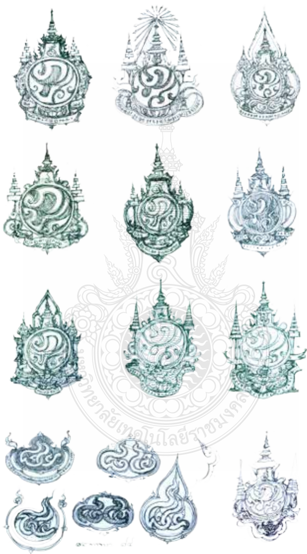
ภาพที่ 16 การออกแบบภาพร่างละเอียดในรูปแบบต่างๆ เพื่อค้นหาตราสัญลักษณ์ที่เหมาะสม