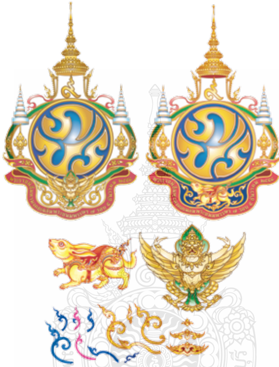
ภาพที่ 20-21 ตราสัญลักษณ์ก่อนกับตราสัญลักษณ์หลังจากปรับใส่รูปกระต่ายแล้ว

เมื่อปรับเปลี่ยนเสร็จแล้วได้นำแบบตราสัญลักษณ์ฯ ที่ผ่านการปรับแก้ไขตามพระบรมราชวินิจฉัยแล้ว นำส่งขึ้นทูลเกล้าไปอีกครั้ง พระบาทสมเด็จพระเจ้าอยู่หัวทรงมีพระราชกระแสกลับมามาว่า “กระต่าย ดูแล้วหนักไม่ว่องไว” สำหรับตราสัญลักษณ์ที่ปรับเสร็จแล้วและนำขึ้นทูลเกล้าในครั้งนี้ ซึ่งถ้าพิจารณาโดยรวมแล้วก็มีความงดงามอยู่แล้วในระดับหนึ่งแล้ว แต่ด้วยสายพระเนตรที่เข้าใจในความงามและสุนทรียภาพของศิลปะ อีกทั้งทรงมีความละเอียดละออ จึงทรงมีพระราชวินิจฉัย ออกมาดังกล่าว