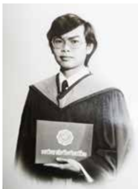
นักศึกษาวิทยาลัยการศึกษา ประสานมิตร 2516-2517