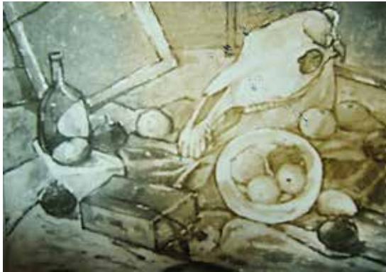
ผลงานเขียนสีน้ำจากภาพหุ่นนิ่ง