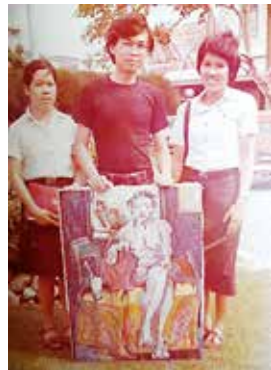
บรรยากาศการเรียนการสอนเขียนภาพนู้ด (Nude) ภาพผู้หญิงเปลือย