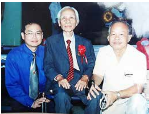
ภาพที่ 1 บุคคลต้นแบบทางศิลปะที่ประทับใจ

ผมมาเป็นครูที่โรงเรียนเพาะช่างเป็นครูผู้ให้เทคนิควิธีการวาดภาพสีน้ำมัน และแนวทางการใช้ชีวิตของความเป็นครูช่าง และยังมีครูที่เป็นต้นแบบให้กับผมอีกหลายท่านครับ เมื่อผมเข้าเป็นนักเรียนโรงเรียนเพาะช่างสิ่งหนึ่งที่ทุกคนถูกปลูกฝังก็คือ ต้องยึดเสาหลักทั้ง 6 ต้น ที่อยู่หน้าตึกอำนวยการโรงเรียนเพาะช่าง ซึ่งท่านศาสตราจารย์ประภิต จิตบัวบุศย์ ศิลปินแห่งชาติ อดีตครูใหญ่ โรงเรียนเพาะช่าง และเป็นผู้ออกแบบก่อสร้างอาคารทรงไทยประยุกต์โรงเรียนเพาะช่างรุ่นแรกๆ เป็นผู้สร้างและกำหนดแนวทางของช่างเพื่อยึดถือปฏิบัติ ผมยังจดจำและนำมาใช้จนถึงทุกวันนี้ เสาหลักทั้ง 6 ต้น ได้แก่ ต้นที่ 1 ช่างจะต้องมีระเบียบ ต้นที่ 2 ช่างจะต้องมีประเพณี ต้นที่ 3 ช่างจะต้องมีหน้าที่ ต้นที่ 4 ช่างต้องมีสามัคคี ต้นที่ 5 ช่างต้องมีอาวุโส และเสาต้นที่ 6 ช่างต้องมีจิตใจ ผมลองมานั่งทบทวนหลักการทั้ง 6 ประการ ผมว่าไม่ล้าสมัยเลยแต่เป็นแก่นแท้สำหรับการอยู่ร่วมกันของบรรดาช่างทั้งปวง หากละเลยไปหรือขาดหายไปบางหลักการจะทำให้ช่างอยู่ร่วมกันค่อนข้างขาดเอกภาพ ผมขอคารวะซึ่งครูครับ