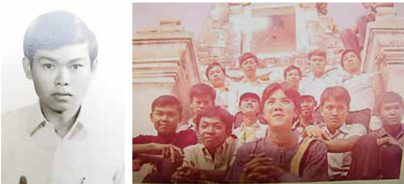
นักศึกษาโรงเรียนเพาะช่าง 2511 - 2515 ถ่ายกับเพื่อน ๆ ที่จังหวัดอยุธยาขณะเรียนวิชาประวัติศาสตร์ศิลป์

ปีที่ 3 ด้วยหากนักศึกษาคณาไประสงค์จะศึกษาต่อให้สูงขึ้นก็สามารถสมัครสอบเพื่อเรียนต่อได้ เพื่อนๆผมส่วนมากก็สมัครสอบเพื่อเข้าเรียนต่อในแผนกฝึกหัดครูมัธยมศึกษา (ป.ม.ช.) มี 2 เวกคือ เวกเขียนกับเวกปั้น ผมสนใจและชอบเขียนรูปจึงสมัครเข้าเวกเขียน และสอบได้จึงได้เรียนต่อที่เพาะช่างอีก 2 ปี