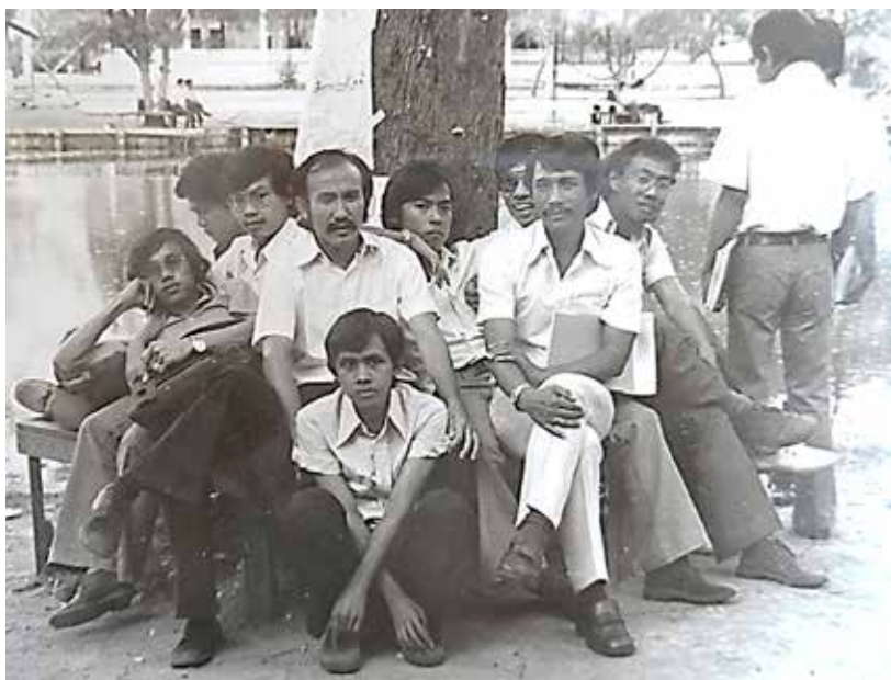
ถ่ายภาพเพื่อนๆ เอกศิลปศึกษา