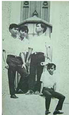
ชีวิตนักศึกษาเพาะช่าง