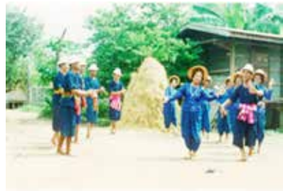
ภาพที่ 3 ภาพการแสดงนาฏศิลป์พื้นเมือง