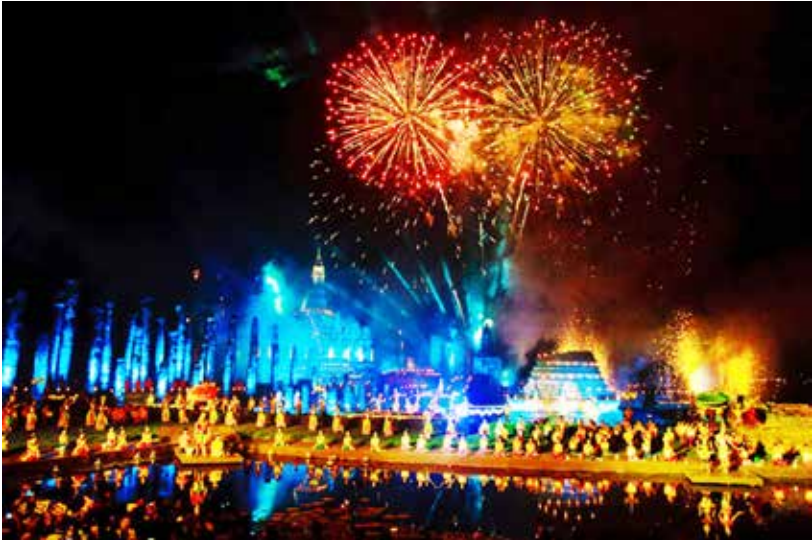
ภาพที่ 6 ภาพการแสดงนาฏศิลป์ไทยในเทศกาลลอยกระทง

สถานศึกษาภาคเอกชนที่สอนนาฏศิลป์ให้แก่เยาวชนหรือผู้ที่สนใจเพื่อส่งเสริมความสามารถและบุคลิกภาพรวมถึงส่งเสริมลักษณะนิสัย