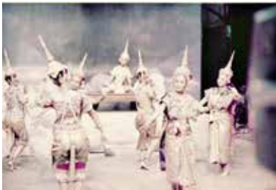
ภาพที่ 2 ภาพการแสดงนาฏศิลป์อนุรักษ์ ที่มา: http://jumpmom.blogspot.com/2011/09/blog-post.html .

จึงมองได้ว่านาฏศิลป์ไทยไม่ใช่แค่เป็นเพียงศิลปะมีลักษณะที่เห็นได้ชัดคือเน้นความสวยงามตามอุดมคติเพียงเท่านั้น อาจถือได้ว่าเป็นแหล่งการเรียนรู้ที่แฝงไว้ด้วยอุดมคติ ความเชื่อที่มนุษย์สร้างขึ้นเพื่อสอดแทรกให้คนในสังคมมีความเข้าใจและปฏิบัติกันต่อๆ มา ที่เรียกว่า ขนบธรรมเนียม เมื่อเกิดการแพร่หลายและรับรู้ในสิ่งที่แสดงออกของคนที่มีความสิ้นไหลไม่ตายตัว และสอดคล้องกับวิถีชีวิตเป็นศิลปะความงามที่มีไว้ใช้ ไม่ใช่ความงามที่มีไว้ชมเพียงอย่างเดียว อันเป็นเรื่องอุดมคติที่แฝงไว้มากกว่าความงามของสุนทรียะที่เป็นจริง