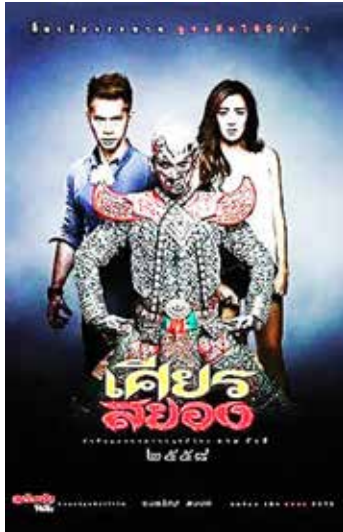
ภาพที่ 9 ภาพโปสเตอร์