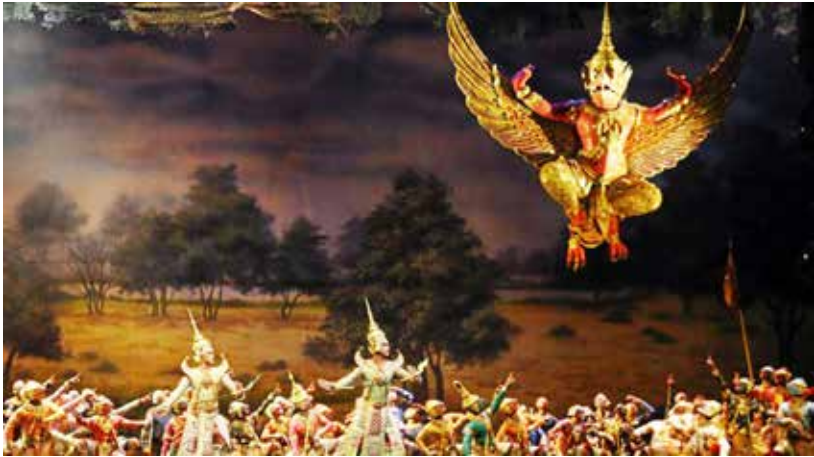
ภาพที่ 7 ภาพการแสดงโขนมุลนิธิส่งเสริมศิลปาชีพฯ ชุดศึกอินทรีชิต ตอนนาคบาศ

บทบาทในการอนุรักษ์และเผยแพร่เอกลักษณ์ของชาติ ปัจจุบันวัฒนธรรมต่างชาติมีอิทธิพลแพร่หลายเข้ามาอย่างมากในสังคมไทย และอาจมีแนวโน้มเป็นไปได้ว่าอนาคตประเทศไทยอาจถูกกลืนทางวัฒนธรรม เพื่อเป็นการธำรงซึ่งความเป็นเอกลักษณ์ของชาติในด้านต่างๆ โดยใช้วิธีการเผยแพร่ อนุรักษ์ และสร้างสรรค์ศิลปะการแสดง นอกจากนี้ยังเป็นการประชาสัมพันธ์และสร้างความเข้าใจอันดีกับประเทศต่างๆ