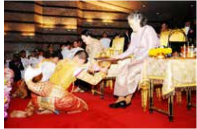
ชุดภาพที่ 4 สมเด็จพระนางเจ้าฯ พระบรมราชินีนาถ เสด็จพระราชดำเนินพร้อมด้วยสมเด็จพระเทพรัตนราชสุดาฯ สยามบรมราชกุมารี ทอดพระเนตรแสดงโขนมุลินิธิสังเสริมศิลปาชีพฯ

จากการสืบทอดนาฏศิลป์ไทยตั้งแต่อดีตมาจนถึงปัจจุบัน อาจกล่าวได้ว่า นาฏศิลป์ไทยตลอดถึงศิลปะที่มีความเกี่ยวข้องข้องกับการแสดงในรูปแบบต่างๆ ล้วนแล้วแต่เป็นส่วนหนึ่งของวัฒนธรรมที่ถูกถ่ายทอดจากสถาบันมหากษัตริย์ลงสู่ในชุมชน เพื่อสร้างความชอบธรรมให้การปกครอง ที่ต้องอาศัยศิลปะและวัฒนธรรมที่สอดแทรกความเชื่อทางศาสนาในการควบคุมความคิด ความอ่านและความเชื่อทั้งนี้เพื่อให้พระมหากษัตริย์ไม่เพียงสถาปนาเป็นศูนย์รวมอำนาจแต่ยังเป็นศูนย์รวมจิตใจความศรัทธาผ่านบทบาทของวรรณกรรมที่นำมาใช้ในการแสดง อาจจะได้เห็นได้จากบทวรรณกรรมเรื่องรามเกียรติ์ในพระบาทสมเด็จพระพุทธยอดฟ้าจุฬาโลก-มหาราช ในฐานะพระราชนิพนธ์เพื่อรวบรวมเรื่องรามเกียรติ์ให้ครบถ้วนตั้งแต่ต้นจนจบ ซึ่งแต่ละบทตอนของรามเกียรติ์นั้นมักถูกนำมาใช้เทียบกับเหตุการณ์ของกษัตริย์ผู้เชื่อว่าประหนึ่งนารายณ์อวตารเป็นพระราม อย่างในสมัยที่พระบาทสมเด็จพระพุทธยอดฟ้าจุฬาโลกมหาราชดำรงตำแหน่งเป็นเจ้าพระยามหากษัตริย์ศึก ได้ประทับพลับพลาหน้าวัดโพธารามก่อนจะลงเรือไปปราบจลาจลที่ฝั่งธนบุรี ด้วยเหตุ