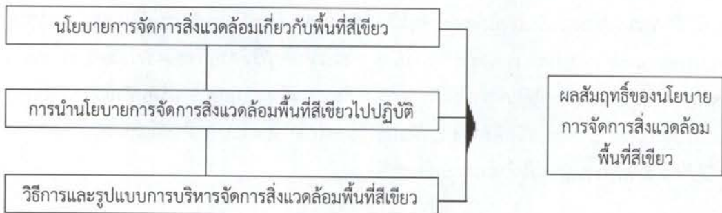
ภาพที่ 1 กรอบแนวคิดการวิจัย